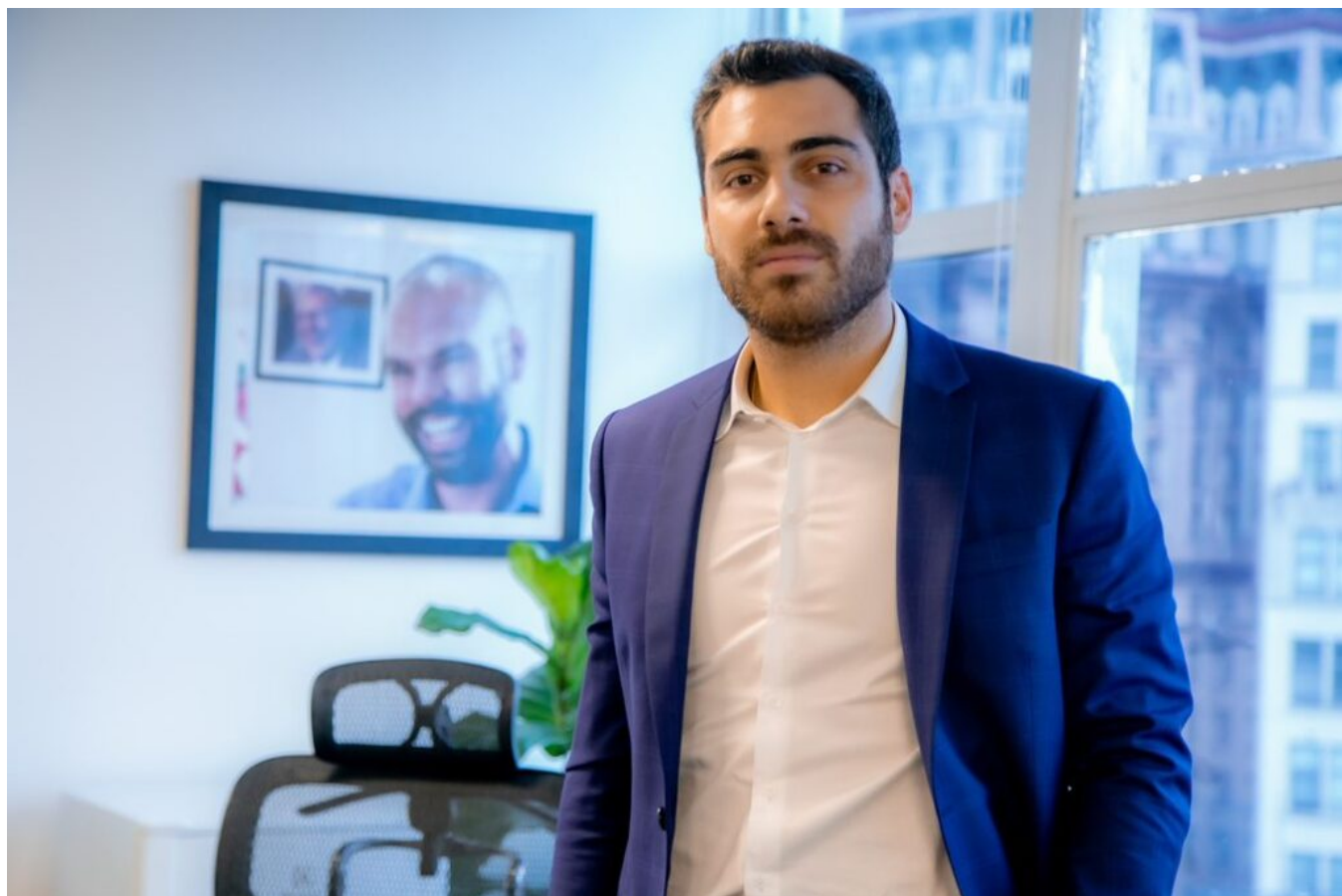
Presidente da SPTuris, Gustavo Pires.

contribuição para a geração de postos de trabalho. Até maio a cidade já havia registrado o saldo positivo de 13 mil empregos com carteira assinada no setor de turismo e eventos, que inclui bares e restaurantes.