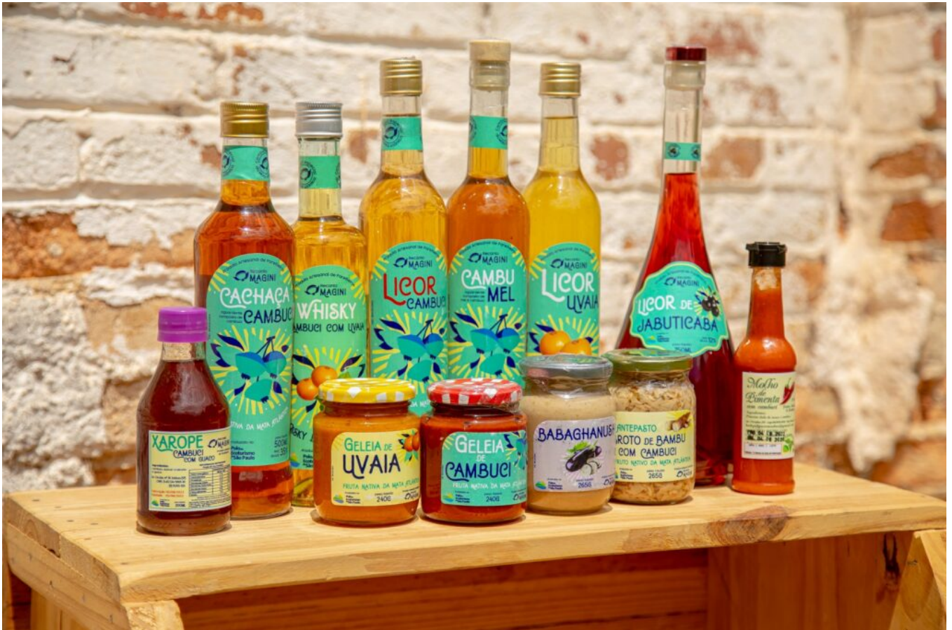
Bebidas e geleias feitas de Cambuci serão apresentadas na feira.

Estão previstas ainda algumas rodas de conversas com especialistas para apresentar os Polos de Ecoturismo da cidade (Parelheiros e Cantareira), turismo de base comunitária, acessibilidade e outros temas, que dão dicas e despertam o interesse em experimentar mais a vida ao ar livre.