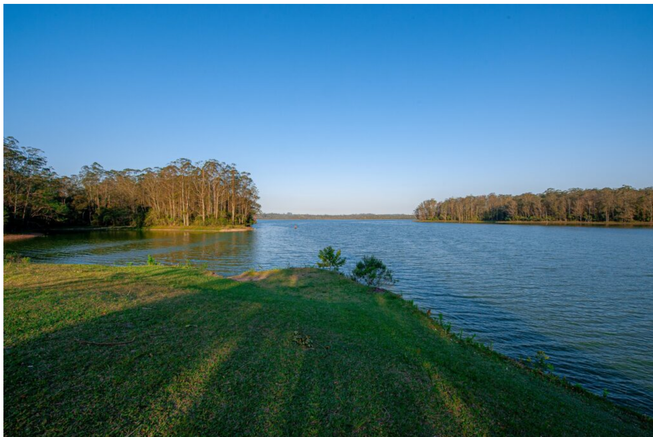
Mirante no Polo de Ecoturismo de São Paulo.

Congresso e Feira de Ecoturismo e Turismo de Aventura acontecem de 1º a 3/12 na Oca do Ibirapuera