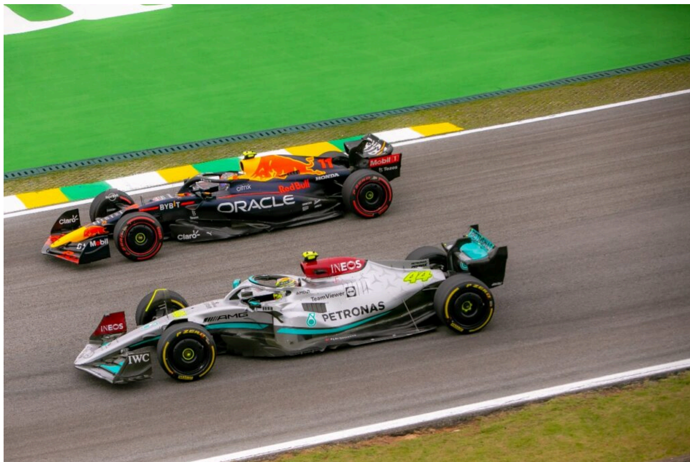
GP São Paulo de Fórmula 1 2022.

Índices registrados em 2022 são, em média, 30% superiores à edição de 2021; valor de exposição de mídia do GP São Paulo deste ano é de US$ 448,6 milhões; público feminino no autódromo aumentou em 75,8%