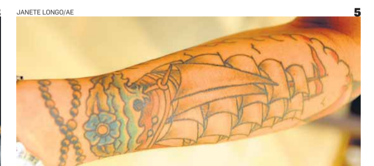
3 JANETE LONGO/AE