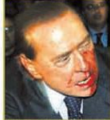
ROSTO de Berlusconi sangra