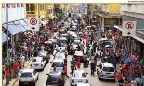
VEÍCULOS formam longas filas na região da Rua 25 de Março na manhã do último sábado

São 678 mil veículos a mais desde fevereiro do ano passado. Frota já atingiu a marca de 6,6 milhões