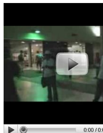
Radar Universitário Destak

O Destak está distribuindo 50 pares de ingressos para o espetáculo infanto-juvenil Cyrano. Veja quem venceres. Saiba mais