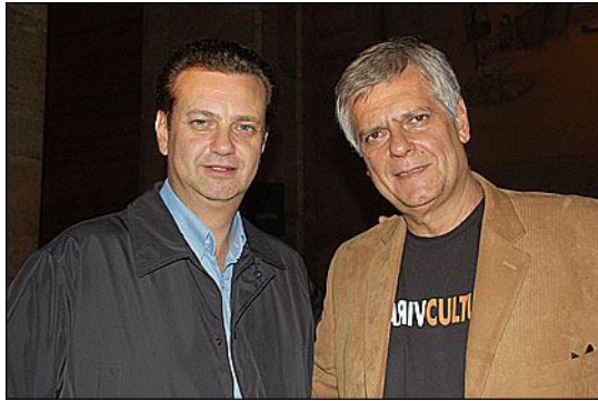
Gilberto Kassab, prefeito de São Paulo e Caio Luiz de Carvalho, presidente da SPTuris

Recorde de público. Esta é a primeira análise da Virada Cultural 2009, segundo o prefeito de São Paulo, Gilberto Kassab. A declaração foi feita durante o jantar de lançamento da quinta edição do evento, que aconteceu hoje (02/05), na sede da prefeitura municipal.