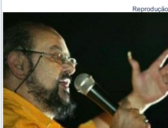
José Mojica Marins

do momento. Tem uma mensagem que a gente tem que mostrar. A violência, o tráfico e a polícia. A coisa está ficando complicada."