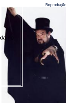
Zé do Caixão na pele de seu

Mojica criticou o cinema brasileiro atual. "Não há bons diretores." Ele entende que a Agência Nacional de Cinema (Ancine) não está investindo em novos talentos. "Tem uma panela do Rio de Janeiro que fica com toda a verba do Estado. Temos que inovar, nem que seja fazendo filmes menores." Apesar disso, elogiou "Cidade de Deus", "Tropa de Elite" e "Meu nome não é Johnny". "Gosto do realismo