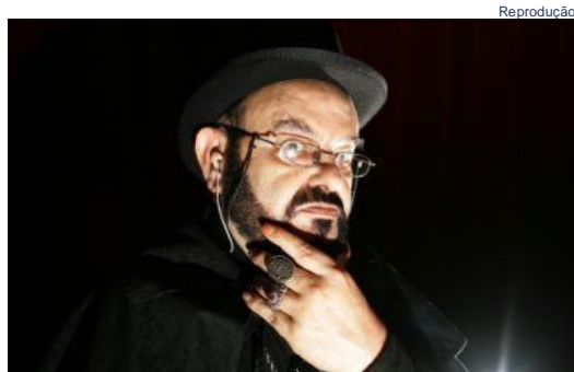
Zé do Caixão continua na ativa e em breve volta aos cinemas

consagrou um estilo próprio de fazer cinema. "Minha única regra é agradar o público, não os críticos. Trabalho para o povão."